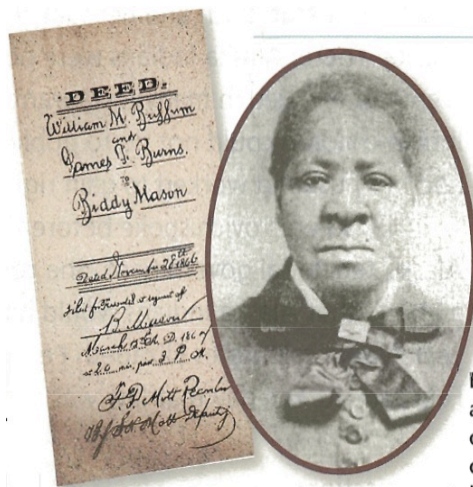
Biddy Mason and the deed, or official record, of the land she bought.

3. Biddy Mason 賺 ㄗㄞˊ 了 ㄌㄞˊ 很 ㄏㄠˇ 多 ㄉㄞˊ 錢 ㄕㄨㄥˊ ，對 ㄉㄞˊ 加 ㄐㄞˊ 州 ㄗㄞˊ 的 ㄉㄜˊ 窮 ㄕㄨㄥˊ 人 ㄖㄣˊ 有 ㄩˋ 什 ㄕㄞˊ 麼 ㄞˊ 影 ㄩˋ 響 ㄩˊ ？